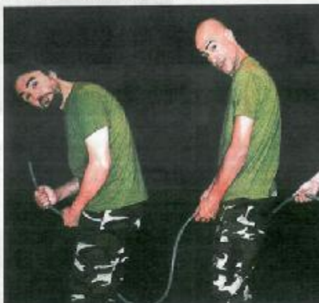
Una escena de la obra.

Tal proceder, y la aceptación del público canario y europeo, les ha llevado a configurar una agenda que les hará pasar sus aperos de acampada por Canarias (el 22 de febrero en Guía y el 23 en Tacoronte), y también por Argelia (en marzo), la República Checa (un mes después), Grecia (en julio, si prospera un acuerdo aún pendiente), Japón, en septiembre, y Corea, territorio virgen para el trío, en octubre.