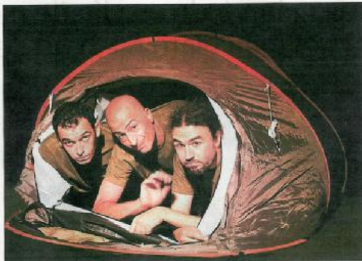
Tres insensatos y tres días de acampada. El resultado, Echando raíces , el nuevo montaje de la compañía.

Hablar de Teatrofía, por otro lado, es hacerlo de una rara avis dentro de la escena canaria que ha logrado el reconocimiento internacional sin haber pasado prácticamente por la caja de subvenciones del Gobierno de Canarias.