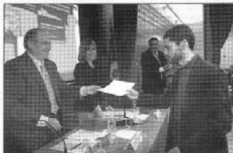
Momento de la entrega de uno de los premios culturales de la Universidad Laguarda.